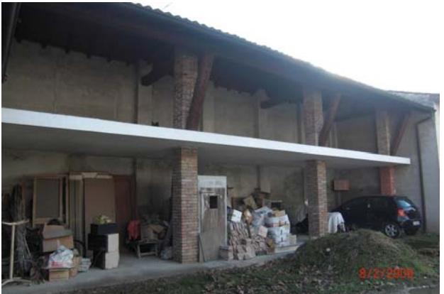
Cascina Maestà n. 29 (??)