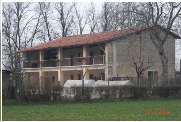
Cascina vicino alla cascina Piombo