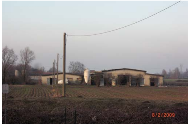
Cascina senza nome n. 35 (azienda agricola Ghilardi)