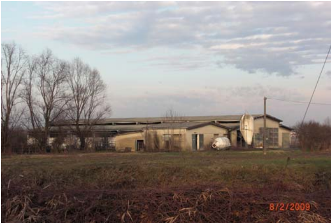
Cascina senza nome n. 34