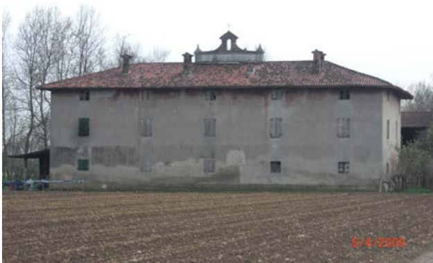
Cascina Mulino Campagna