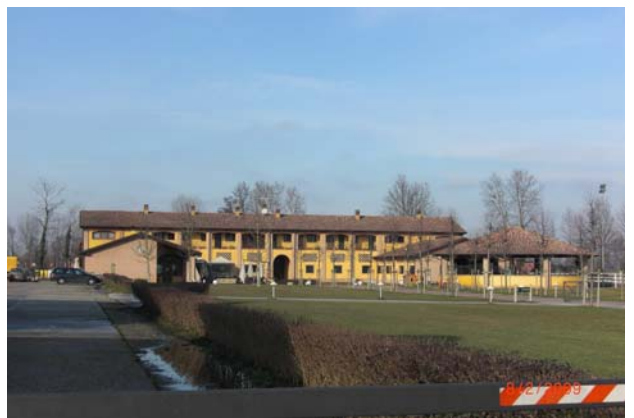
Cascina senza nome n.1 vicino a Garzide di Sotto