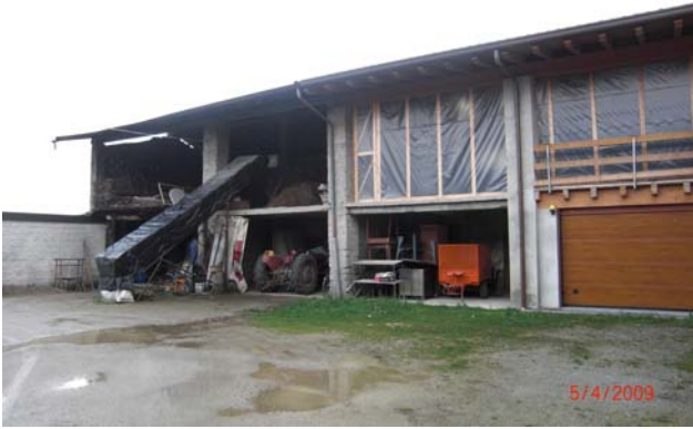
Cascina senza nome a sud della Basella