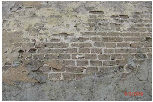
Cascina senza nome a nord del n. 30 e n. 31